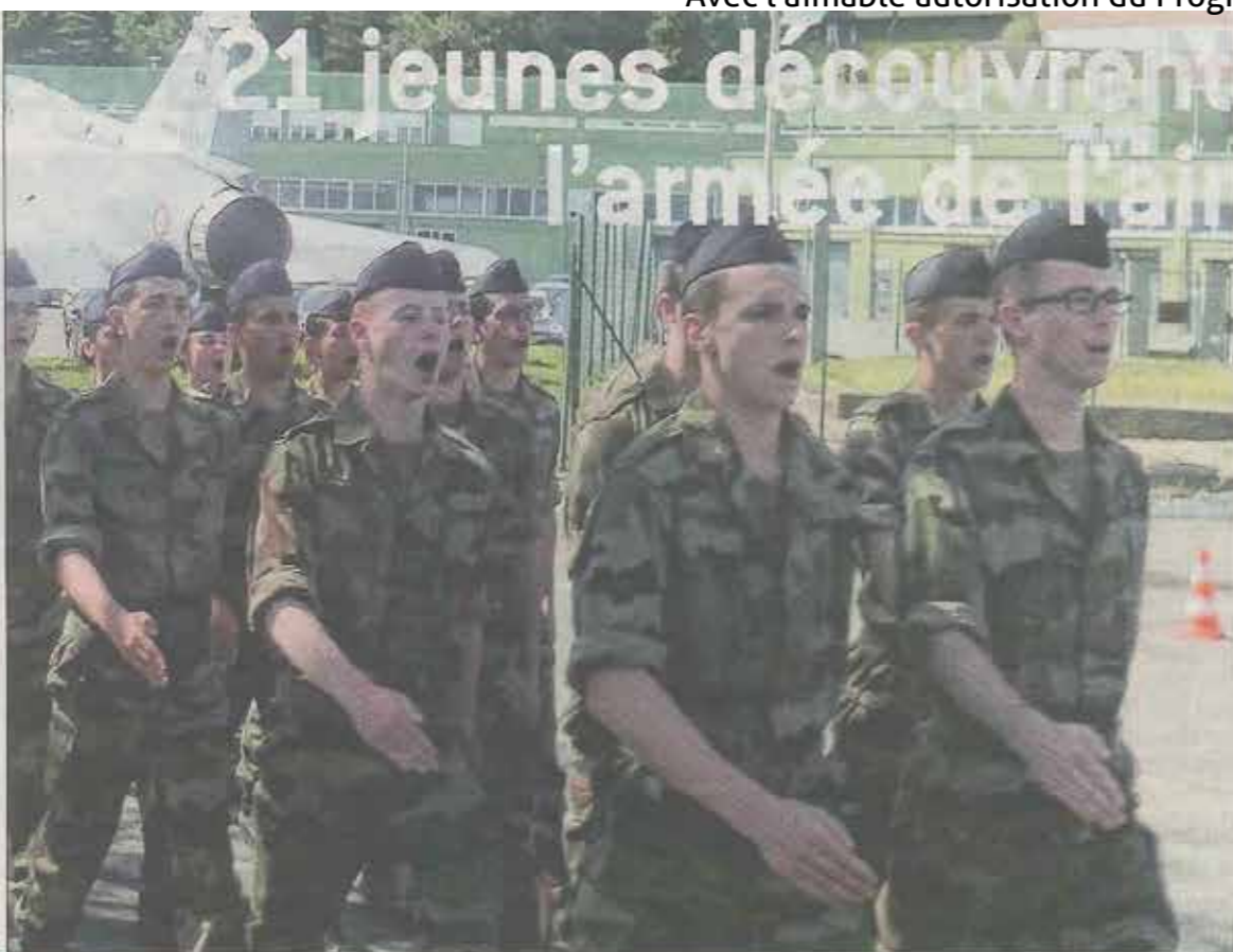
Les jeunes ont marché au rythme de chants militaires.

Depuis huit ans, la base aérienne du mont Verdun organise des Périodes militaires d'initiation et de perfectionnement à la défense nationale (PMIP-DN).