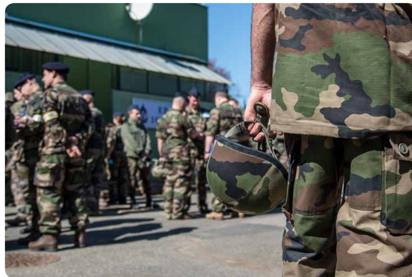
Briefing avant prise de poste